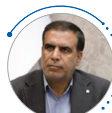
محمد رضا عسگریان فرماندار شهرستان مبارکه