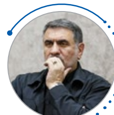
حسین ساجدی نیا رئیس ستاد مدیریت بحران کشور