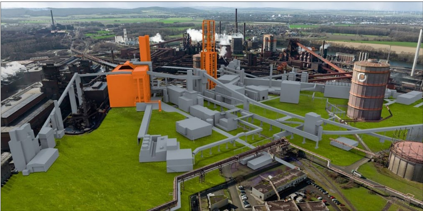
تهیه کننده: واحد پژوهش و نوآوری (پژوهشکده فولاد)

شرکت لینداب استیل زیرمجموعه گروه لینداب سوئد (Lindab Steel AB) و گروه فولادی سالزگیتزر آلمان (Salzgitter GmbH)، در سال ۲۰۲۵، یک تفاهم نامه همکاری امضا کردند که بر اساس آن، لینداب استیل متعهد به دریافت محصولات فولادی تخت کم‌کربن تولید شده از مسیر SALCOS گروه سالزگیتزر خواهد شد. این همکاری، گامی عملی در زنجیره تأمین مواد اولیه پایدار برای محصولات مهندسی ساختمان و سیستم‌های تهویه است که در آن، کاهش چشمگیر ردیاب کربن بدون خدشه بر خواص مکانیکی و عملکردی فولاد هدف اصلی قرار گرفته است. گروه سالزگیتزر، یکی از تولیدکنندگان عمده فولاد تخت در اروپا، برنامه تحول سبز خود را تحت عنوان (Steelmaking Salzgitter LowCO 2 ) از سال ۲۰۱۵ پیگیری می‌کند. این برنامه بر پایه استراتژی جلوگیری مستقیم از انتشار کربن (CDA) بنا شده که هدف آن اجتناب مستقیم از تولید دی‌اکسید کربن در مبدأ است، نه صرفاً جبران آن از طریق اعتبار کربن.